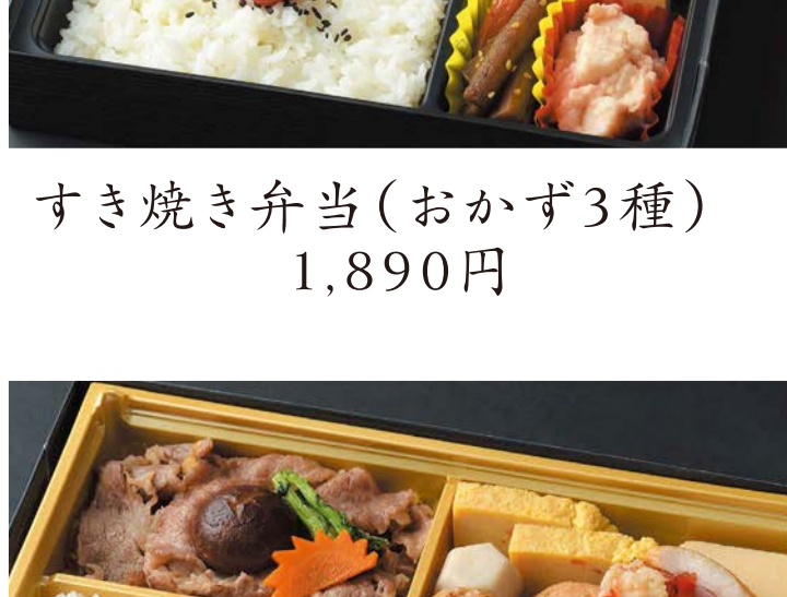
すき焼き弁当(おかず3種)