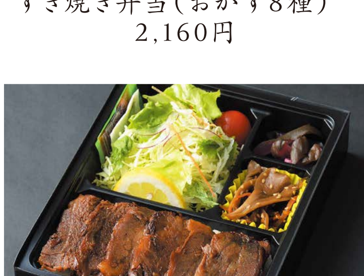
すき焼き弁当(おかず8種)